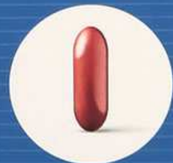
L-Carnitin, Coenzym Q 10