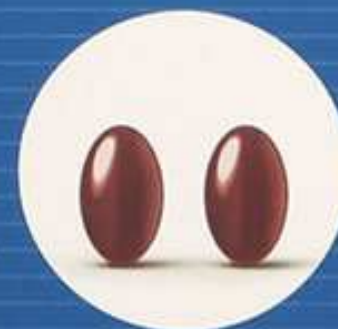
Rotwein-Extrakt, Kakao-Extrakt, Omega-3-Fettsäuren